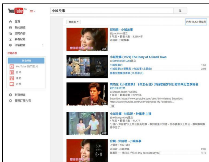
部分影片因授權問題，將會從YOUTUBE搜尋歌曲。