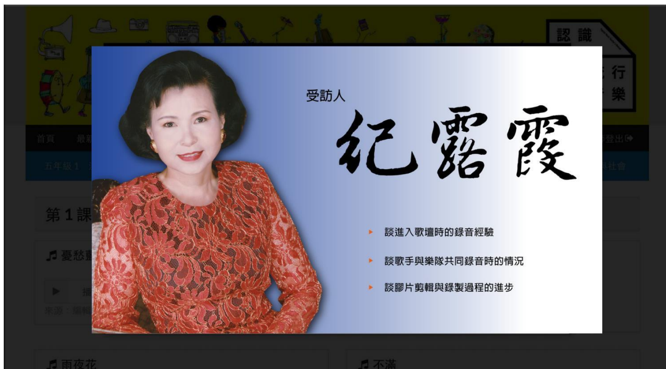
課程自製與採訪影片可於線上直接播放