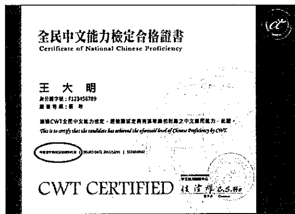
※高、優等證書證號示意圖