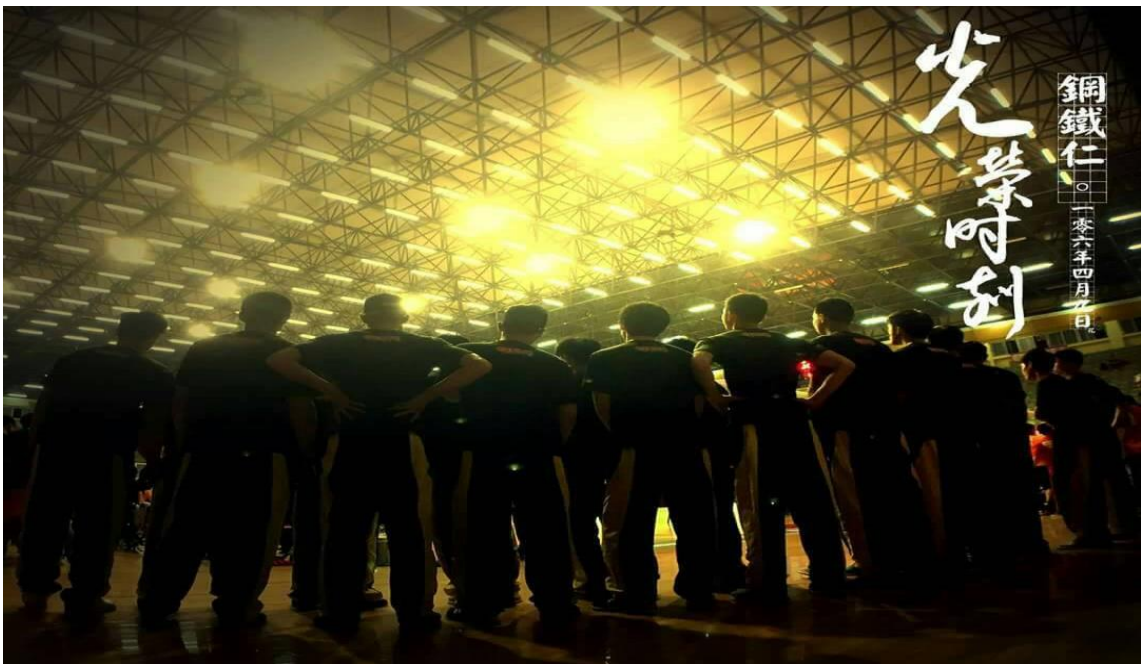
(攝自105學年度高中籃球乙級聯賽全國決賽-全國第二名)

HBL高中籃球甲級聯賽曾是多少熱愛籃球大男孩的夢想殿堂，立仁高中預計明年將帶著嘉義地區鄉親的寄望，挑戰高中最高殿堂，並期許以全國甲組8強為主要目標，大步邁進。