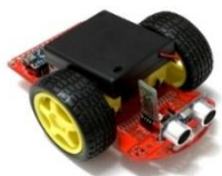
<小阿丟輪型機器人>