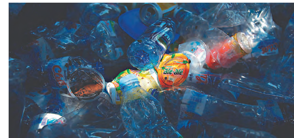
印尼加爾各答的塑膠處理場，堆滿許多廢棄寶特瓶。

無獨有偶，馬來西亞5月下旬將3000公噸的廢棄物退回給美國、日本、法國、加拿大、澳洲和英國。印尼7月則將違反有害與有毒廢棄物進口法規的49只貨櫃廢棄物，退回澳洲、美國、德國及香港。