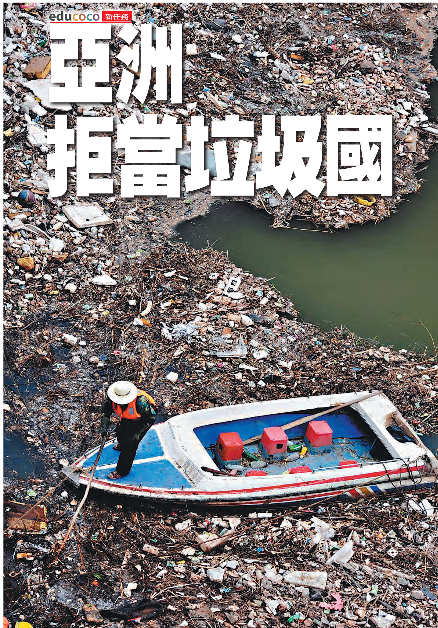
一名男子在佈滿垃圾的黃河撐船。

中國《央視》旗下的《環球電視網》指稱，北京頒布禁止進口西方廢棄物的禁令之後，西方垃圾把東南亞變成「全球垃圾場」。