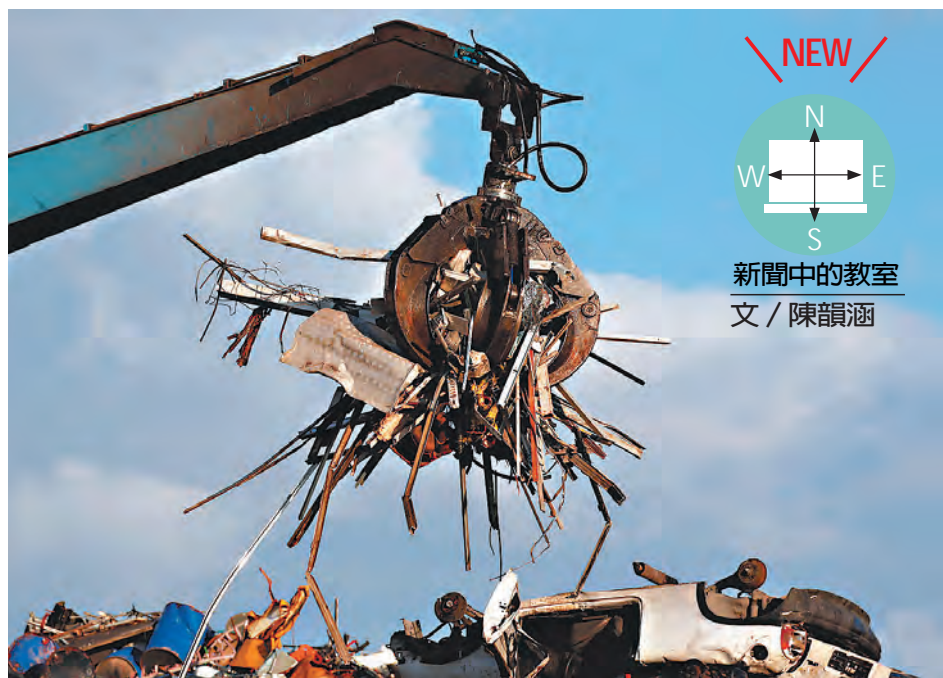
回收場以大型機具夾取廢金屬。