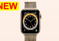
Apple Watch 6 LTE 不鏽鋼米蘭錶環 44mm

● 適用對象：縣市政府及轄下機關員工、員眷、其他申辦資格請洽專員0934287668