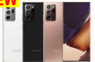
Samsung Galaxy Note 20 Ultra