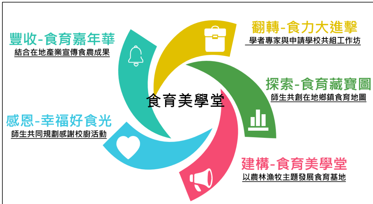
圖 2 本縣食育美學堂概念圖