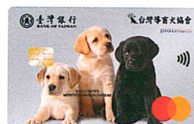
▲一卡通導盲犬認同卡