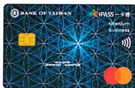
▲一卡通鈦金商旅卡