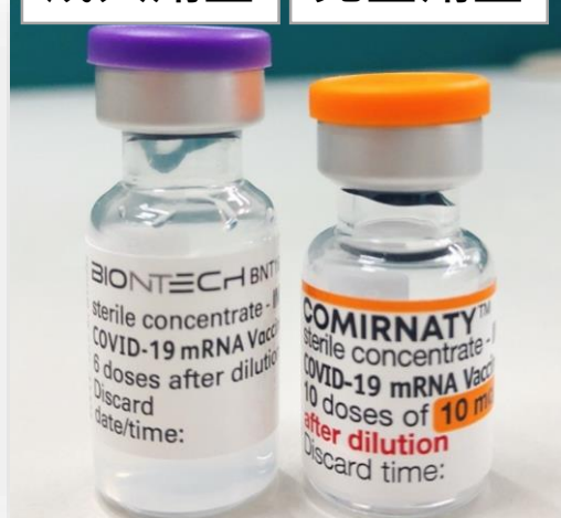
成人劑型 兒童劑型